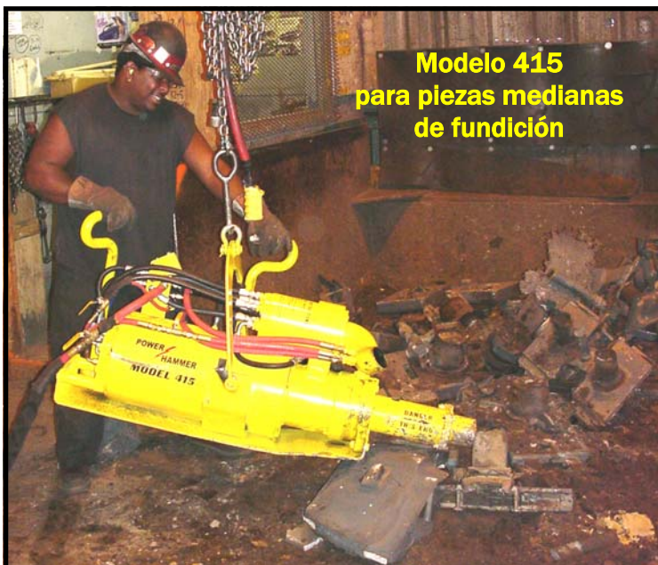
Modelo 415 para piezas medianas de fundición