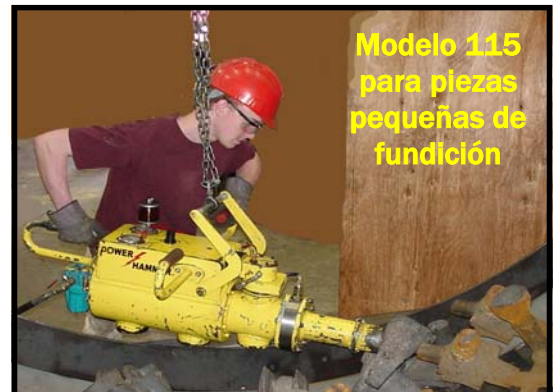
Modelo 115 para piezas pequeñas de fundición

Model 115 Model 215 Model 415 Model 615 Model 815